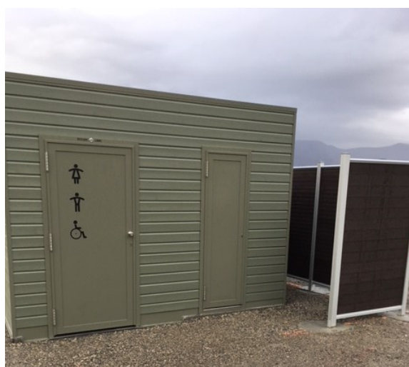
Les toilettes sont terminées et la mise en service imminente...