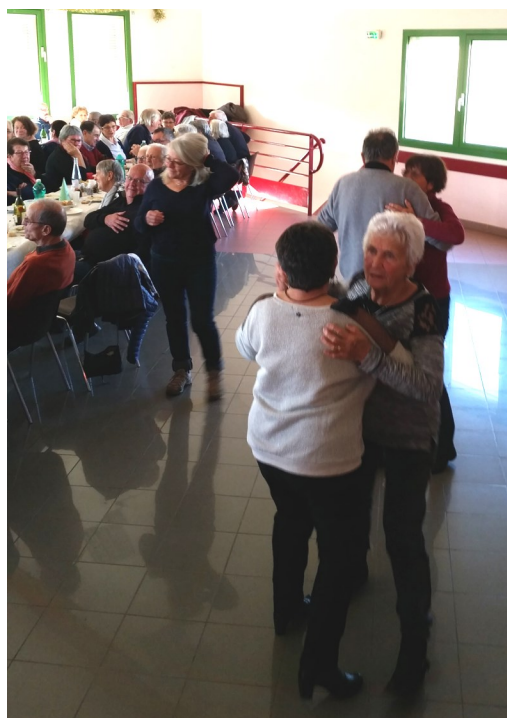
Des danseurs hors pairs ...!!!