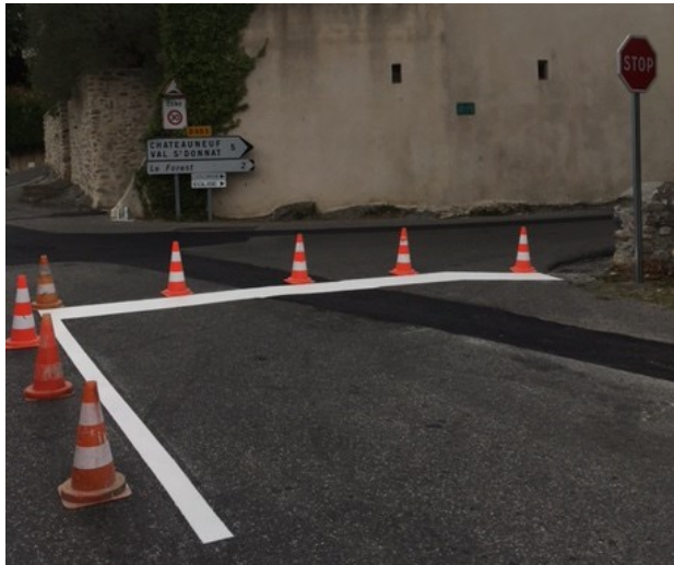
Mise en place du « STOP » au carrefour de la boulangerie

Les travaux se poursuivront dès que possible par le terrassement, la réalisation du sentier jusqu'au quartier de la Vicairie et l'éclairage public.