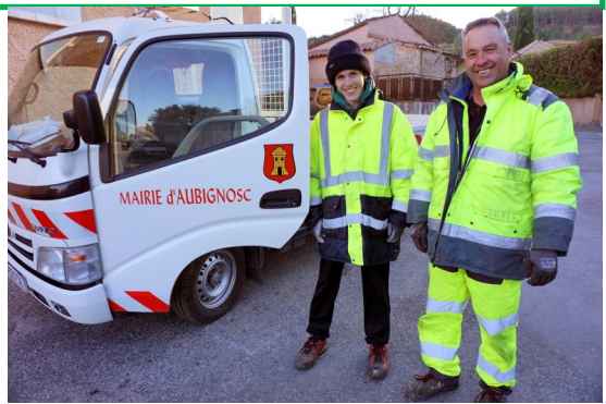
Accueil d'un jeune stagiaire en décembre au service technique