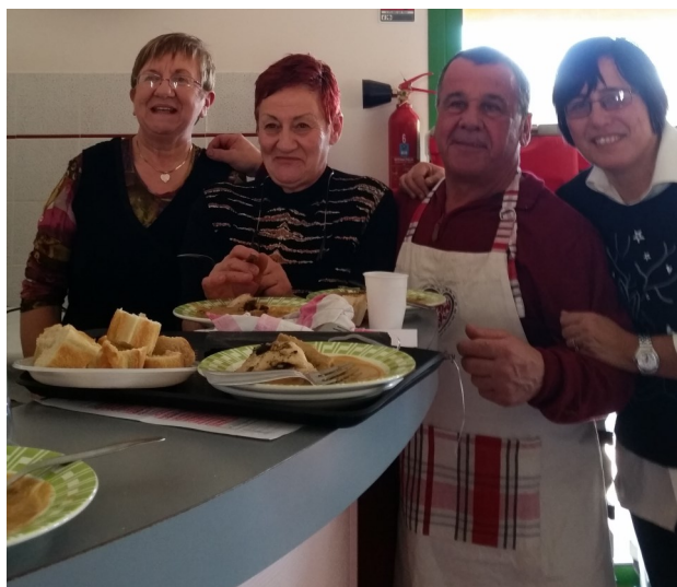
Des aides... efficaces !!!