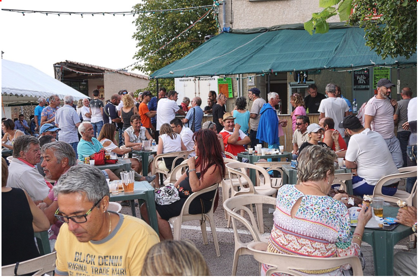
On s'installe pour le spectacle de Zephinine Cie