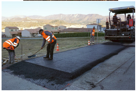
Rue de la mairie