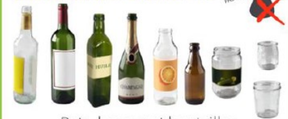
Pots, bocaux et bouteilles Glass jars and bottles