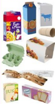
Cartons et briques Cardboard packaging