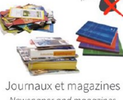
Journaux et magazines Newspaper and magazines