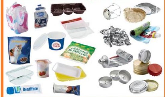
Emballages métalliques Metal packaging