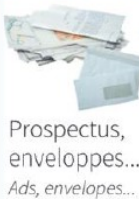
Prospectus, enveloppes... Ads, envelopes...